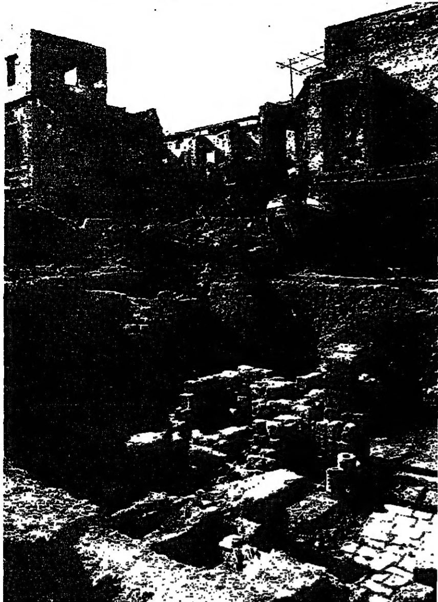
حجارة أثرية نسي مواقع الحفريات أمكن الحفريات في وسط منطقة الاسواق